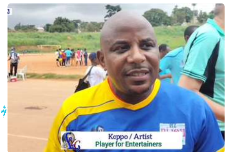
Koppo / Artist Player for Entertainers

Mes impressions sur ce Jamboree sont toutes bonnes parce que j'ai été témoin de l'amour, de l'amitié et du bonheur