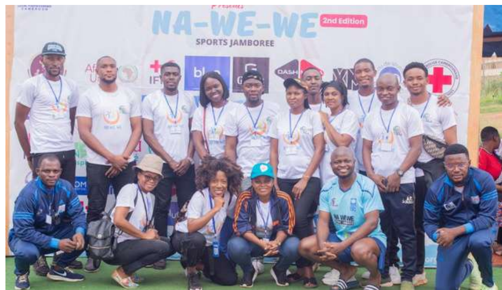
L'éQUIPE ORGANISATRICE -LOYOC