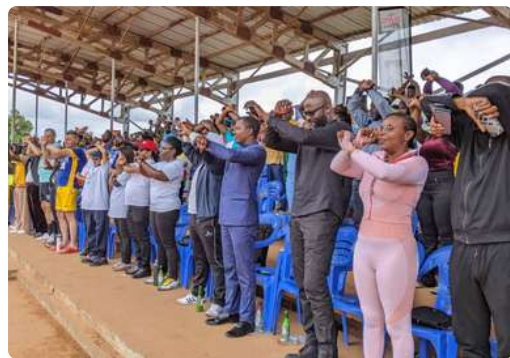
Moments d'Education Civique