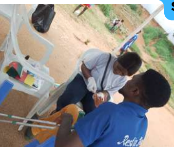
Test médical gratuit, consultation et premiers soins