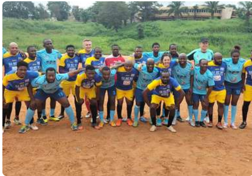
Match de Gala de solidarité avec les influenceurs et la communauté